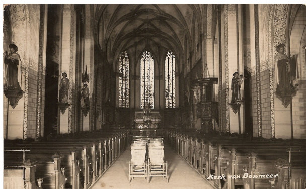
Sint Petruskerk, Boxmeer, 1940